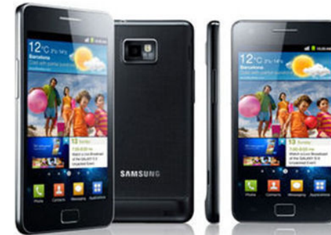
GALAXY S SC-02B 2010.10.28 released